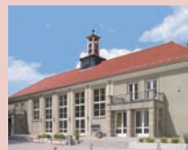
Audimax (Gebäude 11)